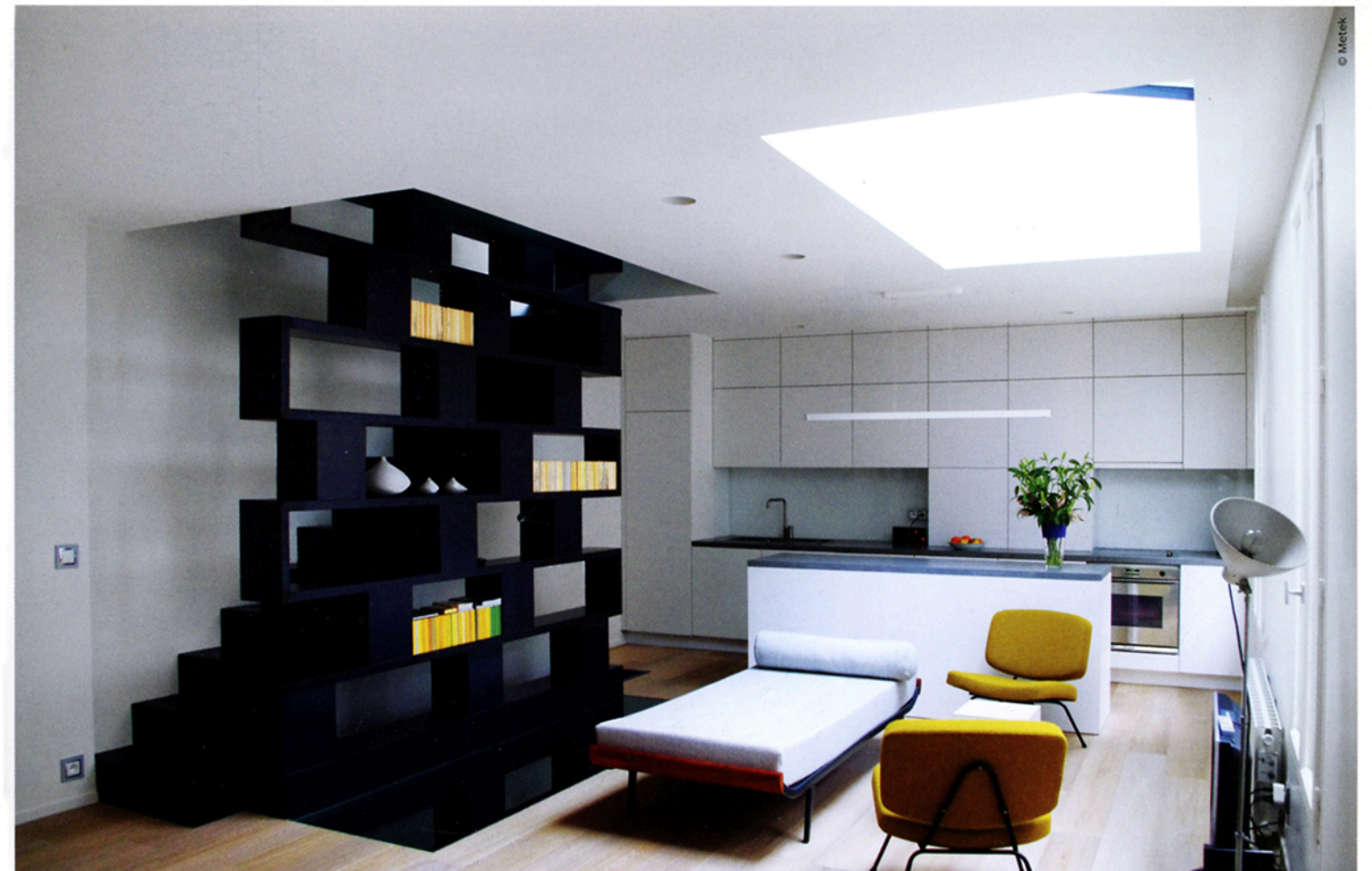
Tout en verticalité, un escalier-étagère de 10 mètres de haut occupe tous les niveaux de cette surélévation parisienne menée par l'agence Metek. L'architecture épurée est accompagnée de pièces de mobilier contemporain élégantes (cf. fauteuil CM 190 de Pierre Paulin).

La ville dense, de plus en plus dense... Nous pouvons l'étendre, mais nous pouvons aussi la modeler de l'intérieur et l'adapter à nos usages actuels et futurs. Façonner la matière est un exercice infini : décloisonner, découper des ouvertures, remodeler